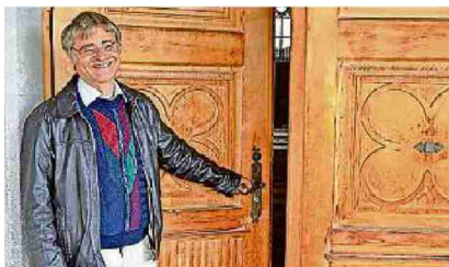
Harald Schade