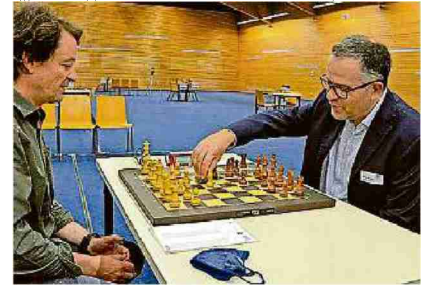
An der Schachmeisterschaft.