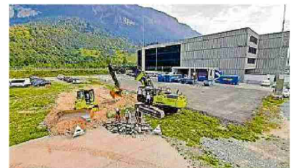
Spatenstich bei Hamilton. Pressebild