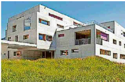
Medizinische Center Bonaduz. Pressebild