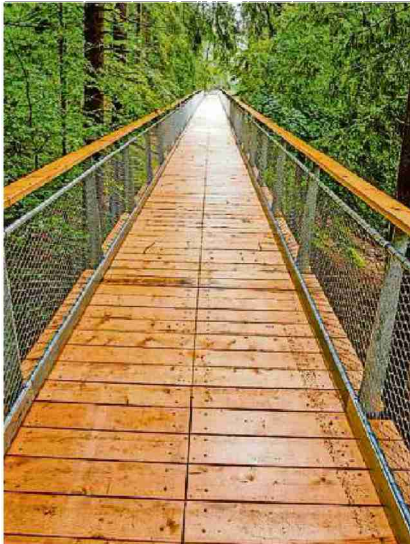
Baumwipfelpfad in Laax