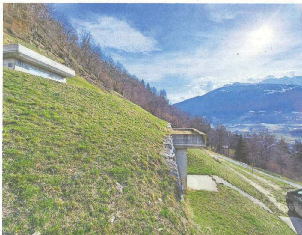
Die beiden Reservoirs Sitgets und Prau befinden sich oberhalb von Quinclas am Nordhang ob Ilanz.

Das Thema der eigenen Wasserversorgung reicht beim Kloster Ilanz sozusagen bis zu den Anfangszeiten zurück. Bereits seit seiner Gründung vor über 130 Jahren besass und betrieb der Verein Institut St. Joseph am Hang oberhalb von Quinclas im Ilanzer Norden eine eigene Wasserversorgung. Die gesamte Anlage aus Wasserfassung, Brunnenstuben, den beiden je 90 000 Liter fassenden Reservoirs Sitgets und Prau Vert, Leitungen und Hydranten wurde 2004 und 2012 grösstenteils saniert. 2016 nahm das Kloster zudem schliesslich oberhalb der beiden Reservoirs das neue Trinkwasserkraftwerk Prau Vert in Betrieb. Seither produziert das kleine Kraftwerk durchschnittlich eine Wassermenge von 160 000 Kubikmeter sowie 285 000 kWh Strom pro Jahr, was gemäss Angaben der Klosterverantwortlichen dem Stromverbrauch von über 80 Haushalten entspricht.