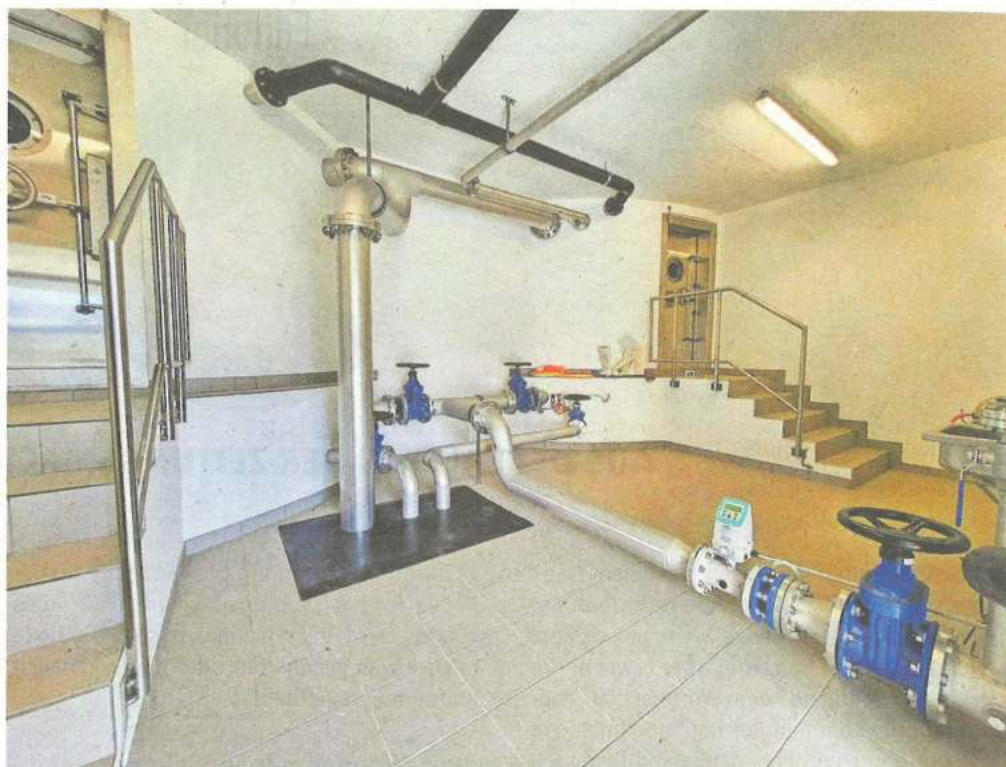
Das Trinkwasserkraftwerk produziert pro Jahr auch Strom für rund 80 Haushalte.