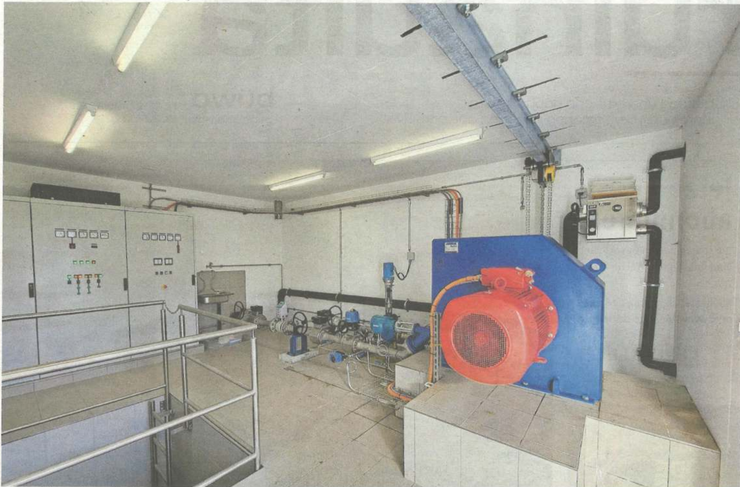
Im Kraftwerk Prau Vert wird pro Jahr durchschnittlich eine Wassermenge von 160 000 Kubikmeter produziert.